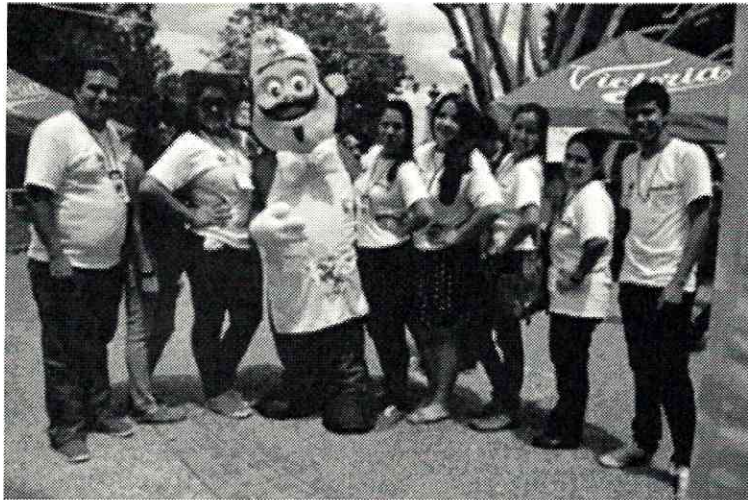
Figura 1.- Estudiantes de la Licenciatura en Desarrollo Turístico Sustentable, colaboradores voluntarios de feria.