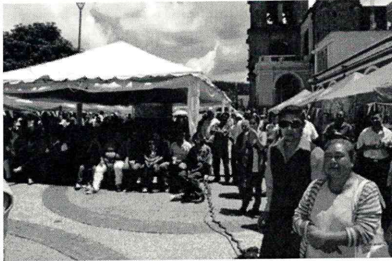
Figura 2.- Visitantes en la Feria Nacional de la Birria, 2016.

El número de personas que asistió a la feria ha sido cambiante en cada una de sus ediciones, en su primer año (2014), tuvo mucho auge y una asistencia aproximada de 40,000 individuos, lo cual se redujo en un 25% para el siguiente (2015), dónde solamente asistieron 30,000 personas, de tal manera que, este número va en descenso. Cómo se mencionó anteriormente, el mayor impacto de la feria, fue durante su primera edición, siendo la única que tuvo una duración de cuatro días, mientras que las otras se han presentado únicamente en tres.