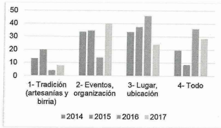
Gráfica 2.- Aspectos que no les gustaron a los turistas asistentes a la Feria Nacional de la Birria.

Cómo se puede mostrar en los gráficos anteriores (Gráfica 1 y Gráfica 2), para los habitantes de Ciudad Guzmán la Feria Nacional de la Birria representa una tradición, ya sea por su consistencia de realizarse año tras año, como por la relevancia de la birria como un platillo típico de la región; además se suma la venta de artesanías que se suele dar en la feria y que resulta del agrado de muchas personas, a pesar de ello, no les agrada mucho el lugar, porque hay mucha gente y al estar fuera de la catedral, algunos lo consideran una falta de respeto, pese a ello es uno de los aspectos de mayor agrado para los turistas, a los cuales les gusta que sea céntrico, así como la forma en que se presentan las instalaciones.